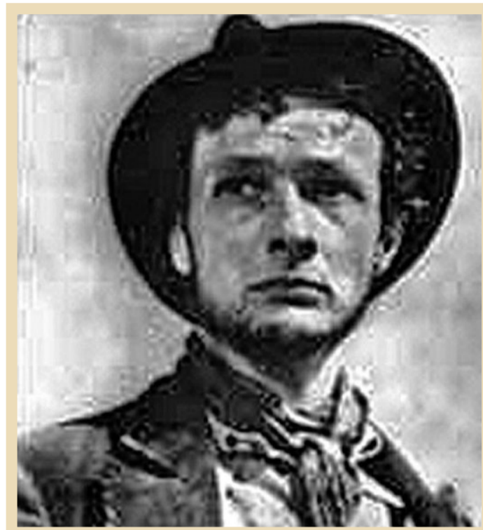
Farinet, der Falschmünzer, hat die Herzen der Bevölkerung erobert, aber die der Behörden nicht erweichen können.

Ist Farinet nun ein Held oder einfach nur ein Betrüger? Die Fakten, die bekannt sind, stützen eher die Version des Betrügers. Joseph-Samuel Farinet wird 1845 in Saint-Rémy-en-Bossonnais geboren. Das Tal wird zu dieser Zeit vom Haus Savoyen regiert. Dort