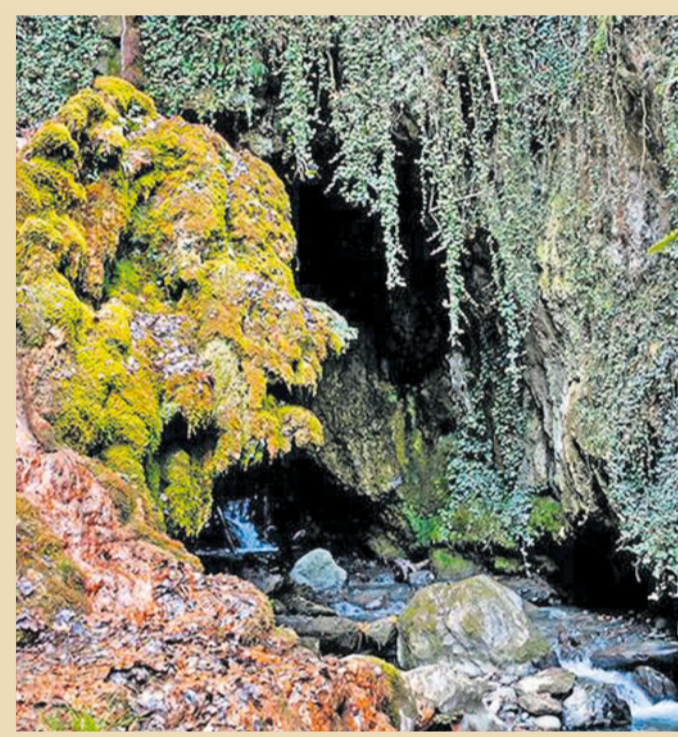
Gustave Courbet malt während eines Aufenthalts im Wallis die Grotte der Giganten, die «Caverne des Géants». Das Werk befindet sich heute im Museum von Amiens.