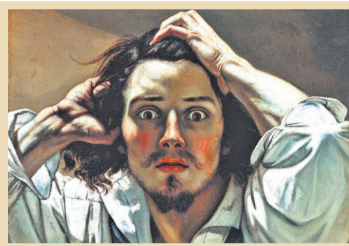
Das Werk von Gustave Courbet verrät die Welt seiner Herkunft nicht, wie dieses Bildnis zeigt.

Die «Grotte der Giganten» in der Schlucht des Flusses Salentse in der Nähe der Thermalquellen beschäftigt die Bewohner von Saillon noch heute. Diese seltsame «Unterwelt» zieht auch Gustave Courbet in seinen Bann, der ein mysteriöses, fast surrealistisches Bild von diesem geheimnisvollen Ort gemalt hat. Es taucht in den Katalogen unter der Bezeichnung «Paysage fantastique aux roches anthropomorphiques» auf. Das Werk wird von einigen Fachleuten auf 1873 datiert und erlangt unter dem Namen «Caverne des Géants» Berühmtheit. Diesen Namen erhält das seltsame Bild nach einer Ausstellung in Saillon, wo die Besucher allsogleich erkennen, welcher Vorlage Courbet sich bedient. Heute befindet sich das Bild im Museum von Amiens in Frankreich.