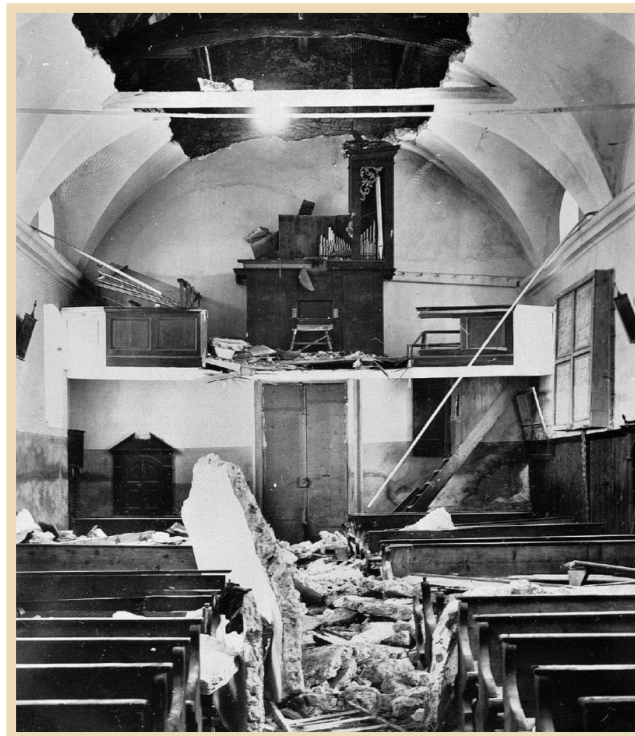
Die Kirche von Nax übersteht als einziges Gebäude den Dorfbrand von 1837, doch dann stürzt 1909 das Gewölbe ein und tötet während der Sonntagsmesse 30 Dorfbewohner.

Der Chronist berichtet, wie die Bewohner von Nax nach einer ersten Panik sehr schnell wieder Tritt fassen und die Dinge an die Hand nehmen. Sie bergen die Toten und sie lassen den Verletzten erste Hilfeleistungen angedeihen. Da es noch keine Telefonverbindungen gibt, eilen Bewohner von Nax die vereisten Wege hinab ins Tal, um Ärzte und andere Retter für die Erste Hilfe aufzubieten. Als sie ins Dorf gelangen, sind die Verletzten bereits in den benachbarten Häusern untergebracht und notdürftig versorgt. Nur das eingestürzte Kirchendach und der Staub erinnern an das Drama. Die Katastrophe